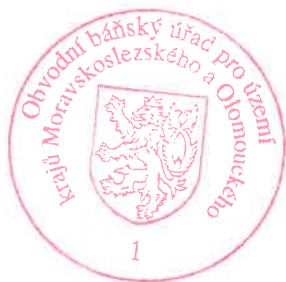
Ing. Bc. Libor Hroch předseda Obvodního báňského úřadu pro území krajů Moravskoslezského a Olomouckého

Podle ustanovení § 81 a násl. zákona č. 500/2004 Sb., správní řád, ve znění pozdějších předpisů, lze proti tomuto rozhodnutí podat odvolání u Obvodního báňského úřadu pro území krajů Moravskoslezského a Olomouckého, Veleslavínova 18, 702 00 Ostrava, ve lhůtě 15 dnů ode dne jeho oznámení. O případném odvolání bude rozhodovat Český báňský úřad v Praze.