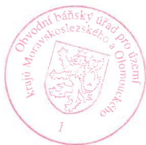
Ing. Bc. Libor Hroch předseda Obvodního báňského úřadu pro území krajů Moravskoslezského a Olomouckého

Podle ustanovení § 81 a násl. zákona č. 500/2004 Sb., správní řád, ve znění pozdějších předpisů, lze proti tomuto rozhodnutí podat odvolání u Obvodního báňského úřadu pro území krajů Moravskoslezského a Olomouckého, Veleslavínova 18, 702 00 Ostrava, ve lhůtě 15 dnů ode dne jeho oznámení. O případném odvolání bude rozhodovat Český báňský úřad v Praze.